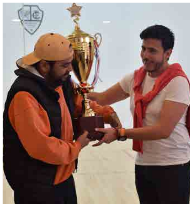
1er. lugar Club The Strongest