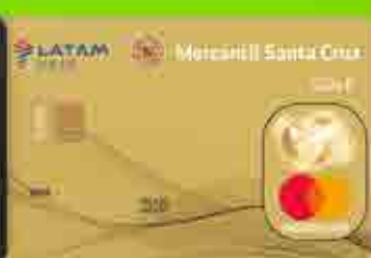
Mastercard Oro LATAM Pass 1 dólar = 1 milla