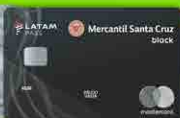
Mastercard Black LATAM Pass 1 dólar = 2 millas