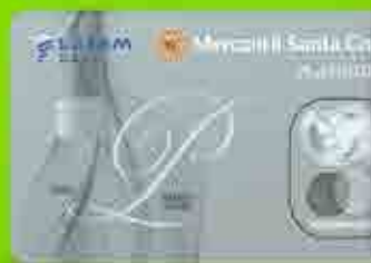
Mastercard Platinum LATAM Pass 1 dólar = 1.25 millas

Solicita la tuya sólo en el Banco Mercantil Santa Cruz y recibe hasta 3.000 millas de bienvenida.